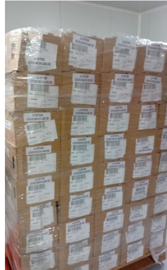
Don de gnocchis