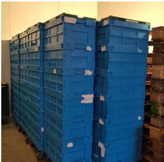
Don de biscuits