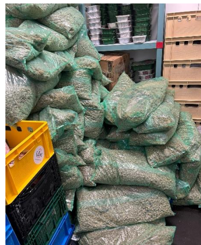
Don de burgers de quorn