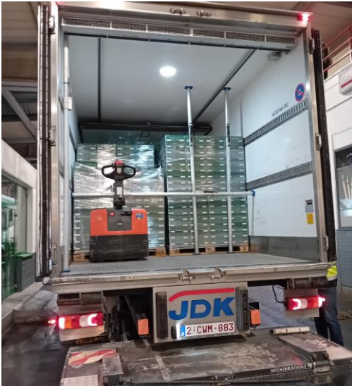
Don de brocolis et jambon